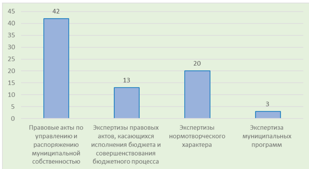
СТРУКТУРА ПОДГОТОВЛЕННЫХ ЗАКЛЮЧЕНИЙ