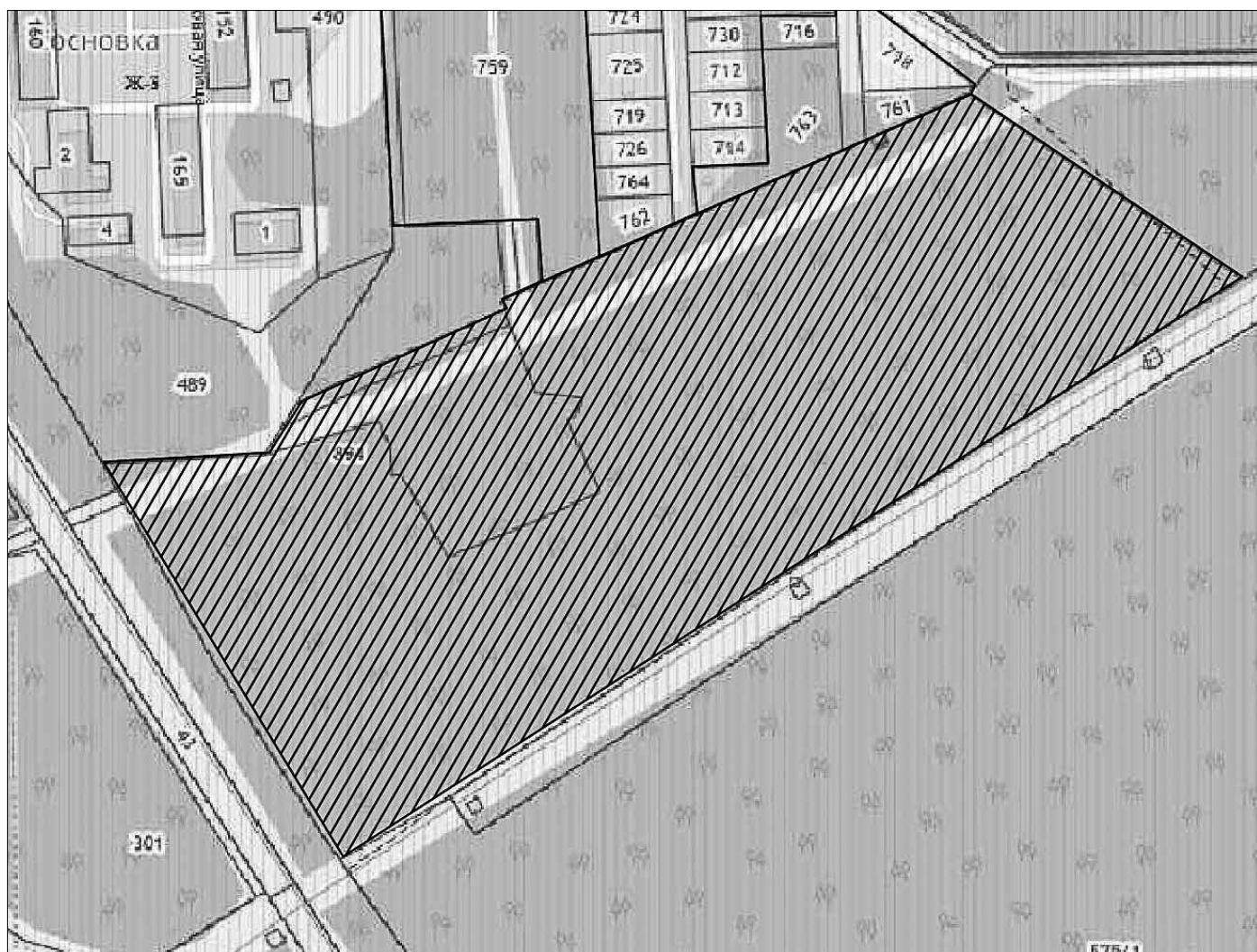
4. Чертеж границ незастроенной территории в границах кадастрового квартала 70:22:0020810 (II очередь), площадью 16,3 га