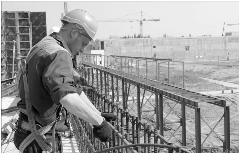
НА ПЛОЩАДКЕ СТРОИТЕЛЬСТВА ОДЭК ПО ПРОЕКТУ «ПРОРЫВ» ПРОДОЛЖАЕТСЯ РАБОТА