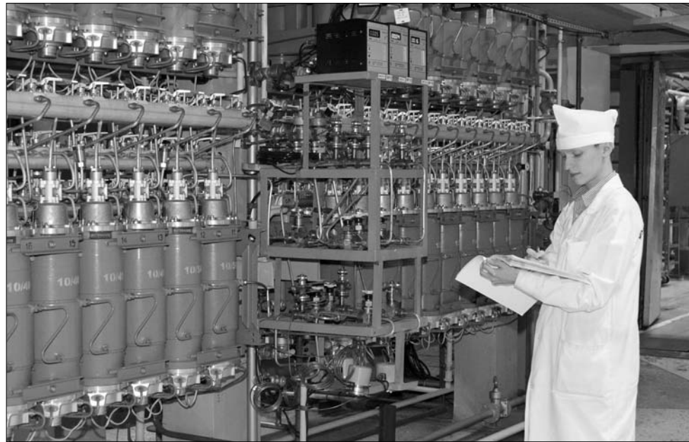
НА ЗРИ С ЯНВАРЯ 2017 ГОДА РАБОТАЕТ НОВАЯ УСТАНОВКА ПО ПРОИЗВОДСТВУ СТАБИЛЬНЫХ ИЗОТОПОВ