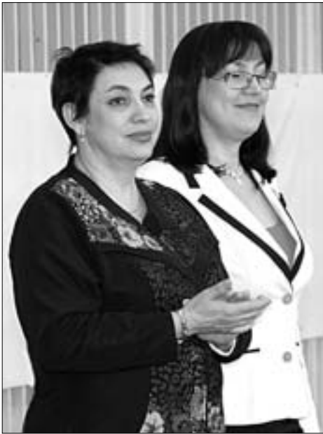
«ЛЮБОВЬ СПОРТУ ВЕСНА!» - ТАКОВО НАЗВАНИЕ НЕОБЫЧНОГО СПОРТИВНОГО ПРАЗДНИКА, ПОСВЯЩЕННОГО МЕЖДУНАРОДНОМУ ЖЕНСКОМУ ДНЮ, КОТОРЫЙ ПРОШЕЛ В СК «ХИМИК» 4 МАРТА.

В чем его уникальность? В веселых спортивных конкурсах участвовали мамы ребятшек с ограниченными возможностями здоровья. Руководитель