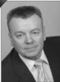
Григорий Шамин, мэр - председатель Думы ЗАТО Северск

Мэр, депутаты Думы и администрация ЗАТО Северск поздравляют вас с замечательным весенним праздником – 8 Марта!