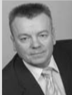
Григорий Шамин, мэр - председатель Думы ЗАТО Северск

Уважаемые северчане! Дорогие наши ветераны! Мэр, депутаты и администрация ЗАТО Северск поздравляют вас с 70-летием Победы советского народа в Великой Отечественной войне!