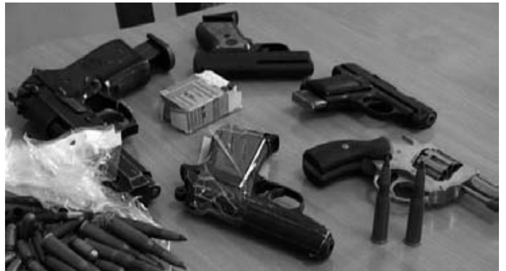
На основании Постановления губернатора Томской области от 31.05.2013 N 225а «О предоставлении выплат гражданам за добровольную сдачу в органы внутренних дел незаконно хранившихся оружия, боеприпасов, взрывчатых веществ и взрывных устройств» гражданам, добровольно сдавшим незаконно хранящееся у них оружие, боеприпасы и взрывчатые вещества, устанавливается денежное вознаграждение в размере: