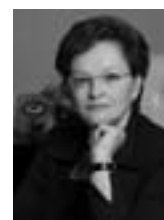
Губернатор Томской области Сергей Жвачкин Председатель Законодательной Думы Томской области Оксана Козловская

Конституция Российской Федерации принята 12 декабря 1993 года всенародным голосованием. С 1994 года Указом Президента России «О Дне Конституции Российской Федерации» день 12 декабря объявлен государственным праздником.