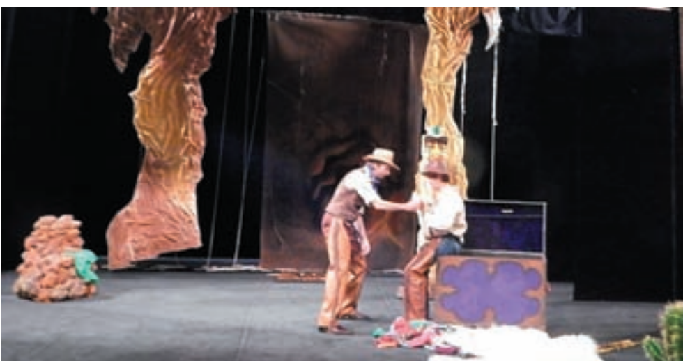
REPETITION SPECTACLE «ВОЖДЬ КРАСНОКОЖИХ»