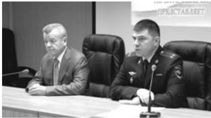
ПРОДОЛЖАЯ ВСТРЕЧИ С ГОРОДСКИМИ КОЛЛЕКТИВАМИ, МЭР ГРИГОРИЙ ШАМИН 29 ДЕКАБРЯ ПОБЫВАЛ В УМВД РОССИИ ПО ЗАТО СЕВЕРСК.